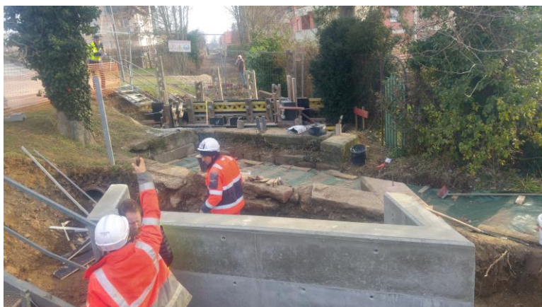
Passerelle, rue des Vosges

Les culées qui permettront d'accueillir la future passerelle, rue des Vosges, sont coulées. La préfabrication de la passerelle est lancée.