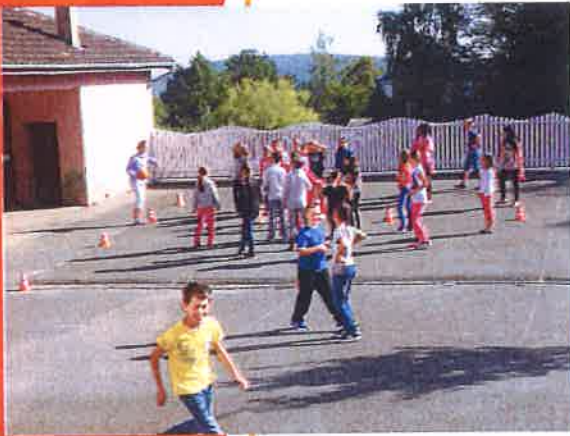
Pendant la récréation...

Notre école se trouve dans le même bâtiment que la mairie de la commune de Saint-Nabor.