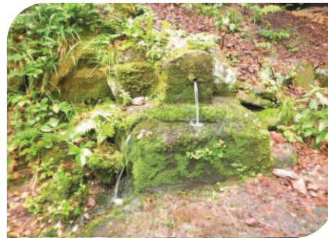
La fontaine Sainte-Lucie

D'ailleurs le mouvement de marée n'est pas réservé qu'aux eaux, il touche également la croûte terrestre. On parle alors de marées crustales. Ce qui pourrait expliquer ces changements de constitution minérale des eaux, plus ou moins soumises, aux influences de l'attraction lunaire, et à des mouvements souterrains au travers de différentes couches géologiques. Et parce qu'elle est pauvre en minéraux, l'eau du Massif est peut-être particulièrement sensible aux variations de minéralité.